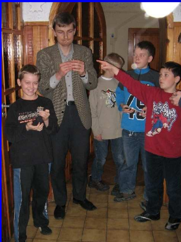
Klubowicze i klubowładni razem