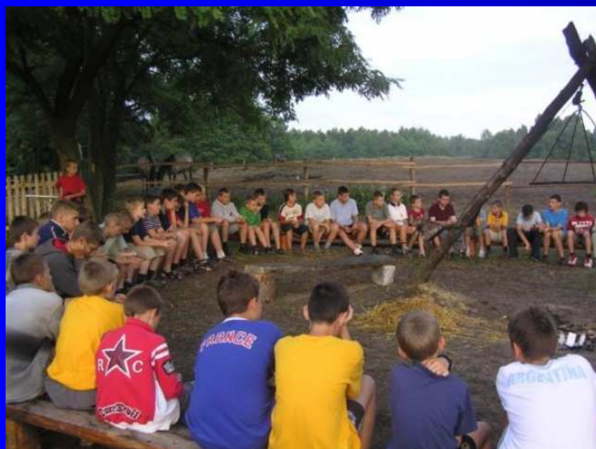
Załoga Ziuty dobija do brzegu