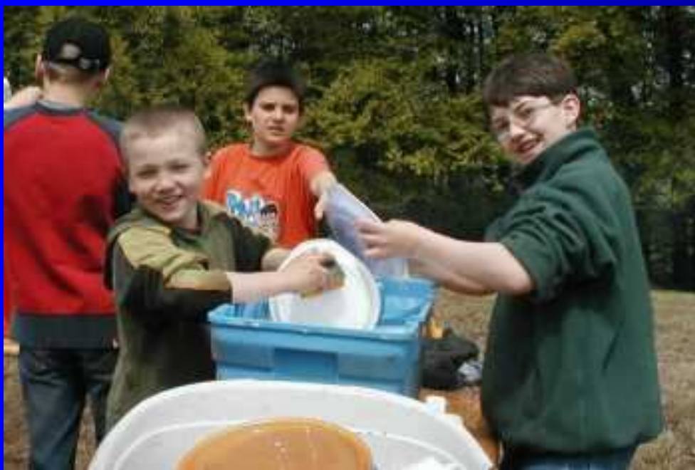
Chłopaki z klubu w Niemczech